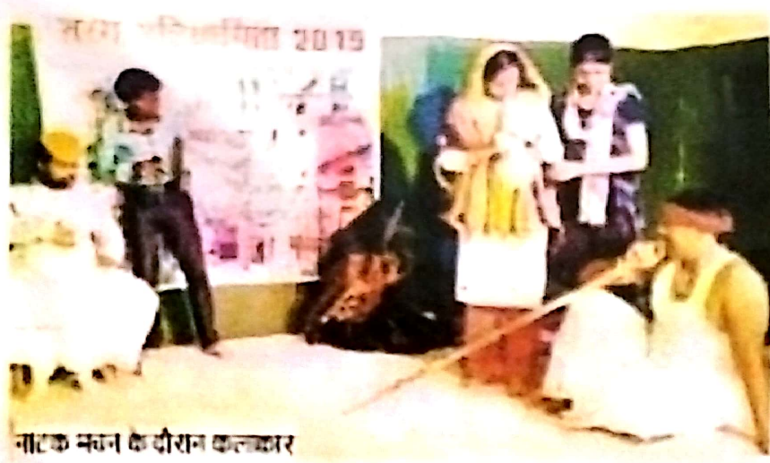
नाटक मंचन के दौरान कलाकार

प्रतियोगिता के समापन के दौरान युवा कॉलेज कट्टामा के प्रतिभागियों को प्रथम पुरस्कार व मधेपुरा कॉलेज मधेपुरा के प्रतिभागियों को द्वितीय पुरस्कार दिया गया।